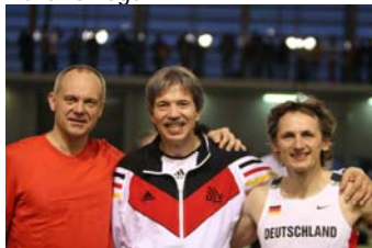
Nach 2 Wettkampftagen können unsere Mehrkämpfer noch lächeln.

Die Ergebnisse unserer Mehrkämpfer kann ich leider nicht liefern, da aufgrund eines defekten Computers diese Resultate noch nicht vorliegen.