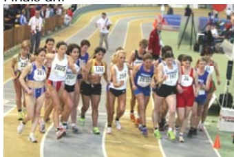
Gedränge am Start der 3.000 m Bahngeherinnen, mit drei deutschen Teilnehmerinnen

Liebe Sportkameradinnen und liebe Sportkameraden, der zweite Wettkampftag brachte die Entscheidungen der 60 m Läuferinnen und 800 m Läufer sowie die Entscheidungen der Mehrkämpfer, und auch im Bahngehen standen bereits einige Finals an.