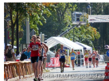
Über die 5km gingen 15 Geher an den Start