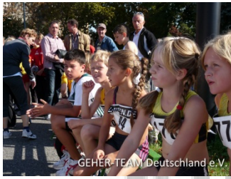
Der Nachwuchs nach den 1km Bestzeit, sondern war auch 20 Sekunden schneller, als letzte Woche in Gleina.

1:25:33h unterbot er seine erste 20km-Zeit, vom März, um fast viereinhalb Minuten. Er und seine Trainerin waren mit dem Ergebnis mehr als zufrieden.