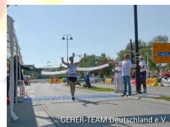
Jesús Ángel García aus Spanien gewinnt die 50km in 3:48:11h